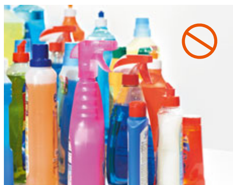
Не использовать химические моющие средства