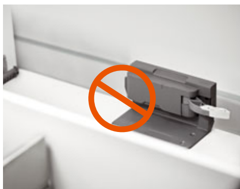
SERVO-DRIVE, электрическая система открывания